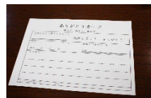
社員間のコミュニケーションを高める「ありがとうカード」を導入

「社員が一番の財産と考え健康経営に取り組んできた」様々な働き方改革の取り組みにより、「健康経営優良法人」に2017年から5年連続で認定。2021年には優良な上位500社に対して新しく付与されることになった「ブライツ500」の認定も受けている。